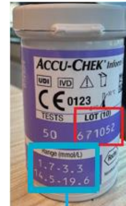
Gräns för godkänd intern kontroll

Reagens (testremsa): Hållbart till utgångsdatum vid förvaring i rumstemperatur.