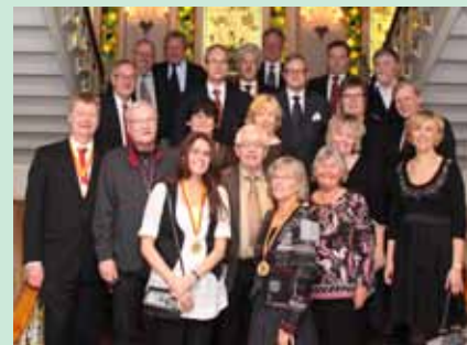
Alla nyblivna pensionärer och 25-åringar fångade i trappan i anrika Grand Hotel i Lund. Omelett någon...?