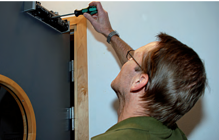
Dörrstängare - ingår eller ej?

En gränsdragningslista används vid hyresförhandlingar och vid kostnadsfördelning i samband med om- och nybyggnation. Den förklarar förhållandet mellan hyresgästen och hyresvärden, när det gäller kostnader för byggnadsdelar och utrustning.