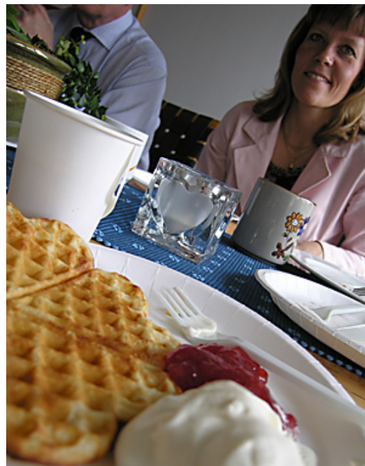
Våfflor - receptet på hur man framkallar leenden mitt i veckan.