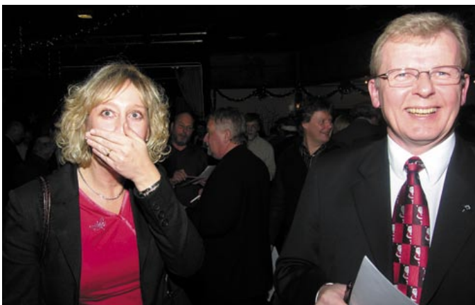
- Opps, vad sa jag nu då?

V i låter årets sista Nyhetsbrev vara lätt i anslaget och ägnar därför hela numret åt RegionFastigheters historiska Julfest på Törringelund. Den 14 december kom bussarna i rad, fyllda med glada, förväntansfulla och nyfikna medarbetare från Skånes alla hörn. Visst var det kul att se så många nya ansikten. För det är ju så att i en organisation spridd över ett stort geografiskt område, är det inte självklart att alla känner varandra. Bäst illustrerades detta av att många