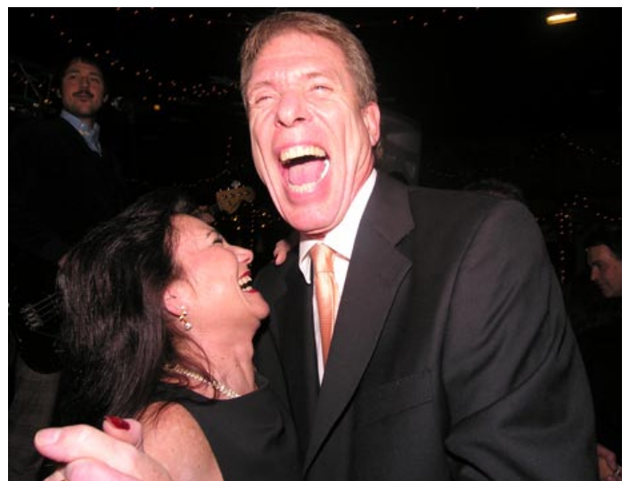
Tänk att det kan vara så här roligt att dansa!

Till slut konstaterades att någon vinnare denna afton omöjligt kunde särskiljas ur mängden alla avgick med heder och ära i behåll!