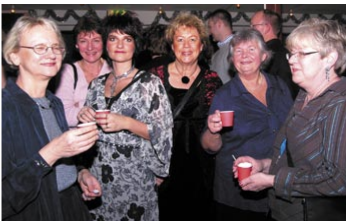
...men flickorna lyssnar bara på Latin!