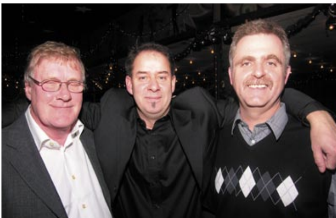
Grabbarna i Lund är fena på spanska...