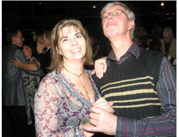
Jodå, jag är stolt som en fjällskivling, titta bara!