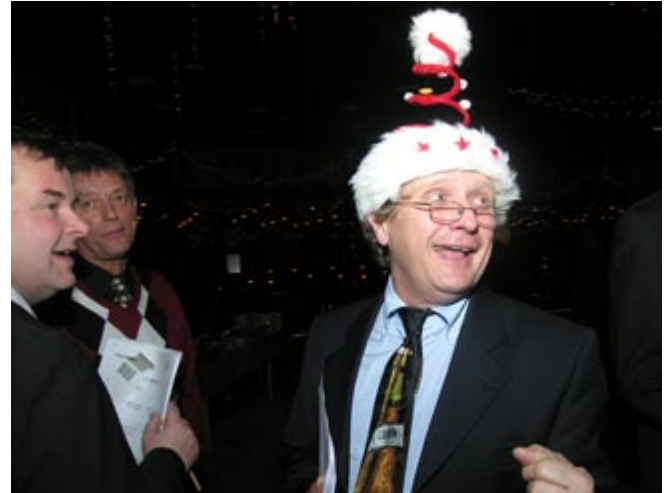
Hmm...det här börjar likna mössans julafton!