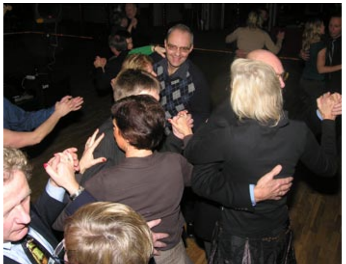
-Går vi ofta hit?

Fotografen gav sig med risk för liv och hälsa ut på golvet för att komma så nära in på stridens hetta som möjligt. Det var ju här kampen om julskinkan skulle avgöras.