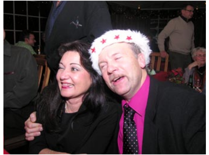
- Får man ta hunden med sig in i himlen...?