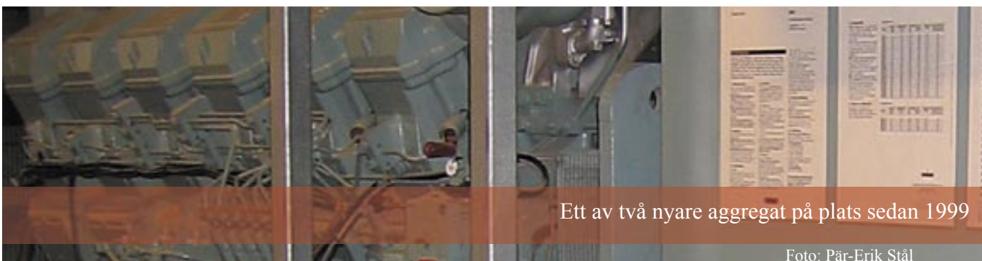
Ett av två nyare aggregat på plats sedan 1999

Arbetet med att installera det sista reservkraftaggregatet startar i dagarna och beräknas vara i drift mot slutet av sommaren 2007.