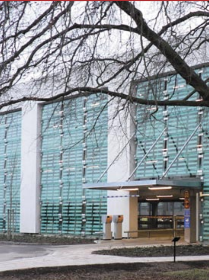
Det nya och efterlängtrade parkeringshuset vid Helsingborgs lasarett.