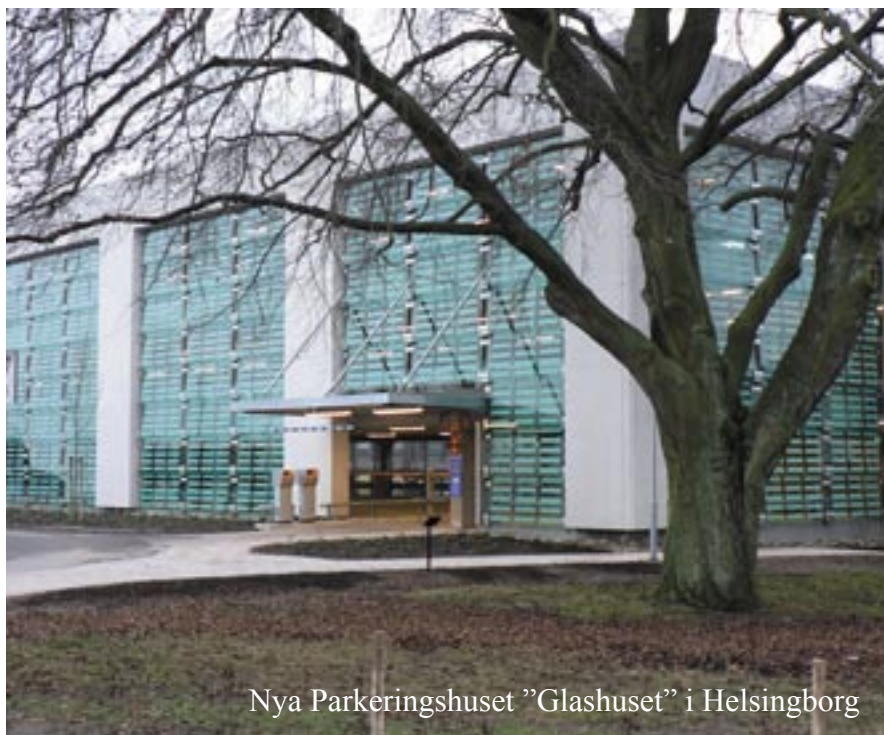
Nya Parkeringshuset "Glashuset" i Helsingborg

Stor möda har dessutom lagts på att rädda blodboken, som står vid västra gaveln (se bilden). Detta träd är den sista resten av den ursprungliga sjukhusmiljön från 1800-talet!