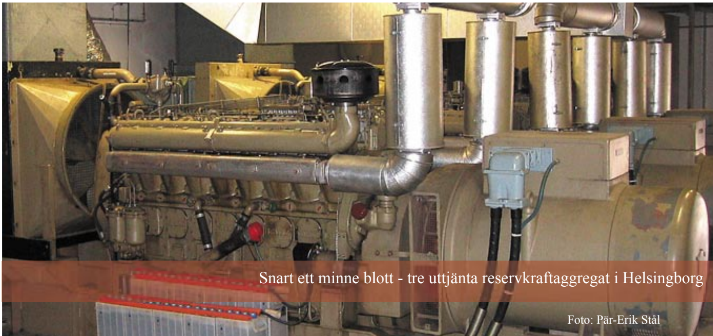
Snart ett minne blott - tre uttjänta reservkraftaggregat i Helsingborg