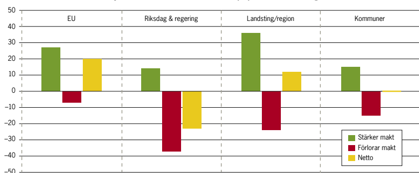
Om du blickar 10 år in i framtiden (2016), vilken politisk nivå tror du har stärkt respektive förlorat mest makt? (%) Bas 93 riksdagsledamöter.

När det gäller Ansvarskommittén och Författningsutredningens effekter så svarar drygt var tionde riksdagsledamot att de förslag som kommer får omvälvande effekter, till exempel att nya nivåer introduceras eller tas bort och att maktförhållandena ändras i grunden. Var tredje tror däremot på förändringar som ändrade maktförhållanden och befogenheter, medan hälften bara räknar med vissa ändringar eller status quo.