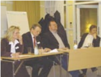
Att regionerna har en framtid var panelen enig om – frågan är bara när och hur. Det kommer att ta lång tid innan en ny struktur är på plats.

mot i Ansvarskommittén, framhöll att regionerna har blivit viktigare till följd av globaliseringen och regionförstoring.