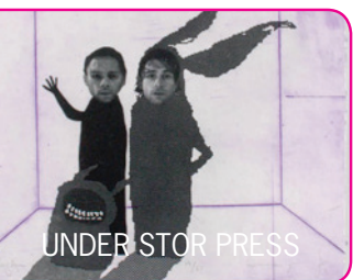
UNDER STOR PRESS