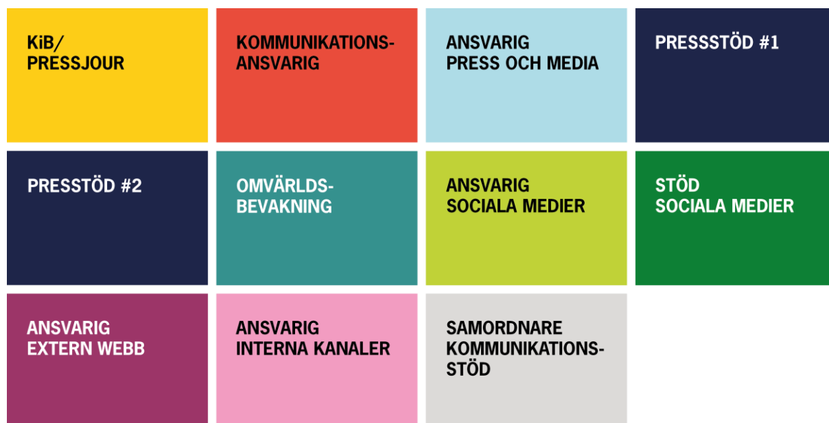
Figur 1. Rollkort kriskommunikation

För att säkerställa att beredskapen för kriskommunikation är god har ett regiongemensamt arbetssätt utarbetats för att kunna omfatta faserna före, under och efter en samhällsstörning. Särskilt utarbetade rollkort, åtgärdskort och regiongemensamma mallar för kriskommunikation har tagits fram som strategiskt och operativt stöd och ska användas av kommunikatörer vid inträffade händelser. Kris korten tydliggör roller, ansvar och arbetsuppgifter och kan utifrån sin utformning anpassas för Region Skånes olika verksamheter. Koncernstab kommunikation, Koncernkontoret, ansvarar för revidering och utveckling av kris korten och de regiongemensamma mallarna. Likaså för att bemanna den regionala beredskapsfunktionen Region Skånes kommunikatör i beredskap, RS KiB.